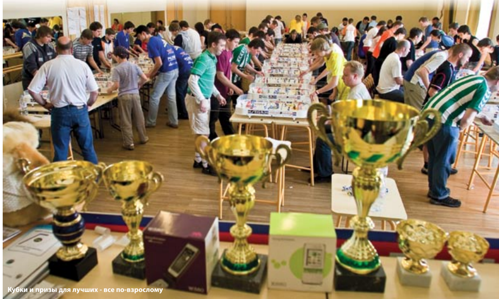
Кубки и призы для лучших - все по-взрослому

- В чем особенность таллиннского этапа Кубка? Есть ли какие-нибудь эксклюзивные отличия от остальных?